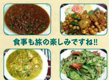
食事の旅の楽しみですね!!

1タカ=約1.3円。食事は200タカ程度でオリジナルなご当地グルメが食べられます。町のいたるところで飲まれている、煮出した紅茶にコンデンスミルクを入れた「バングラティー」は、1杯2タカから5タカ程度。現地に必要なお金はお土産代金ぐらいいです。