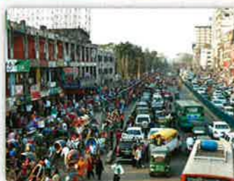
ダッカの街の様子。道はリキシャとよばれる乗り物でいっぱいです

▶ ダッカ着・観光・素材調達 ダッカ泊 終日:ダッカ観光(オールドダッカ(下車) ショドルガッド(下車) ピンクパレス(下車) ニューマーケット(下車) 国会議事堂(車窓) スラム地域の視察(下車)) 観光時にご希望の方はエコバッグ制作時に必要な素材を購入いただくことも可能です。 バングラデシュを肌で体感! まずはバングラデシュの現状を肌で感じるダッカ観光。市街を探索したり、市場で買い物や食事をしたり、現地の人々の実際の生活を体験することを通じて、この社会のリアルな現状が肌で体感できます。エコバッグ制作のための素材調達にも挑戦!