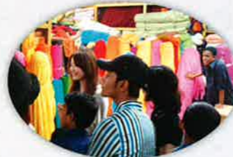
「エク メートル コト タカ? (1メートルいくらですか?)」と聞いてみよう!