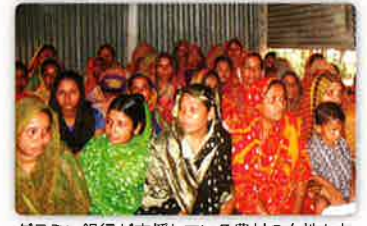
グラミン銀行が支援している農村の女性たちの声を聞きます

午前:グラミン銀行が支援している農村のプロジェクトを視察 午後:マザーハウス工場見学。マザーハウス現地ディレクターとスタッフからの歓迎スピーチ